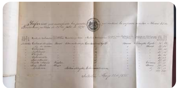
Informe de escuelas existentes y número de alumnos en Tultitlán en el año de 1895. Documento del AHMT (Archivo Histórico Municipal de Tultitlán), sección Educación.

Un logro importante fue la obligatoriedad de la enseñanza, aunque más de la mitad de niños y niñas en edad escolar seguían siendo analfabetas, la posibilidad de tener acceso a la educación se concentraba en las ciudades, a pesar de que, en el país, el 70 por ciento de los mexicanos vivían en zonas rurales. En 1888, siendo Justo Sierra minis-