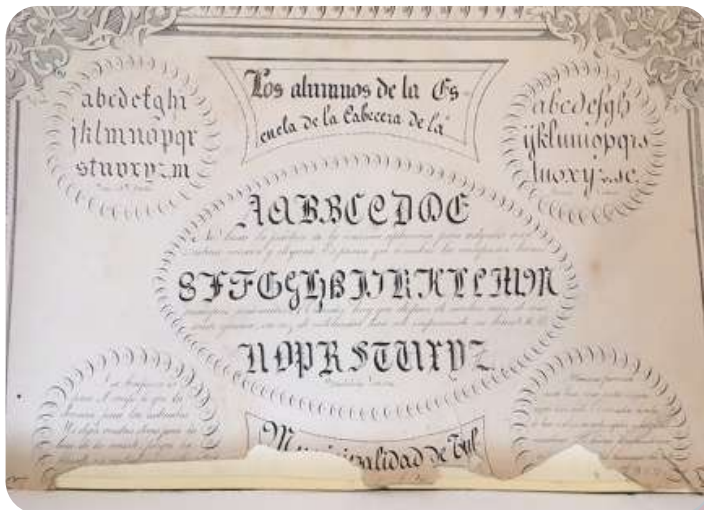
Abecedario o alfabeto de 1905, documento del AHMT (Archivo Histórico Municipal de Tultitlán).

Para el desarrollo de las actividades académicas, los libros de texto y guía para la enseñanza en estas escuelas durante 1912 comprendía algunos de los siguientes recursos bibliográficos: Silabario de J.A. Castro, Lecturas infantiles, La mujer en el hogar I y II, Lecturas Mexicanas I y II de Amado Nervo, Lecturas enciclopédicas mexicanas, y Aritmética.