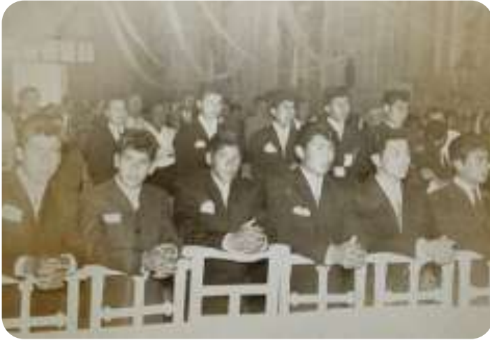
Misa de graduación de la primera generación de la secundaria en la parroquia de San Antonio.

cabecera para invitar a los padres de familia para que inscribieran a sus hijos y así poder cubrir este requisito de la matrícula escolar.