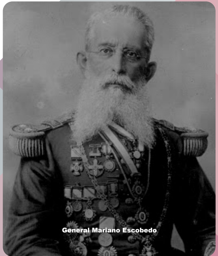
General Mariano Escobedo