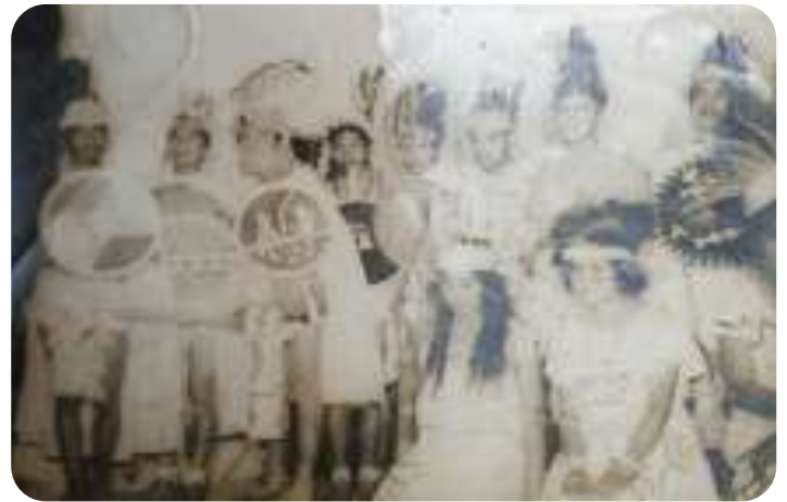
Alumnos de la primera generación en una Danza prehispánica en un evento del 15 de Septiembre.

en el Municipio de Tultitlán, se conformó una cooperativa con padres de familia preocupados por esta situación, ya que quienes querían y tenían la posibilidad de mandar a sus hijos a cursar la secundaria, los mandaban hasta Cuautitlán.