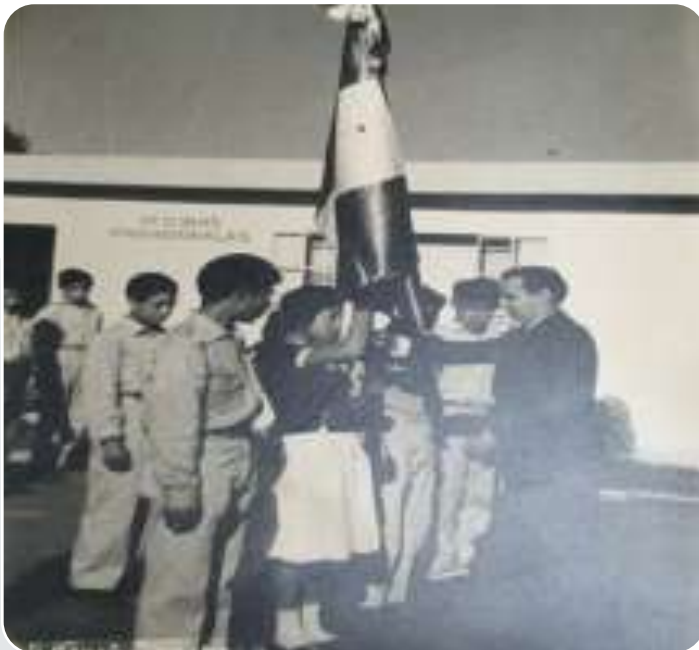
Honores a la bandera en los salones acondicionados en el palacio municipal.

Teniendo la necesidad de una institución educativa para los jóvenes que salían de la primaria aquí