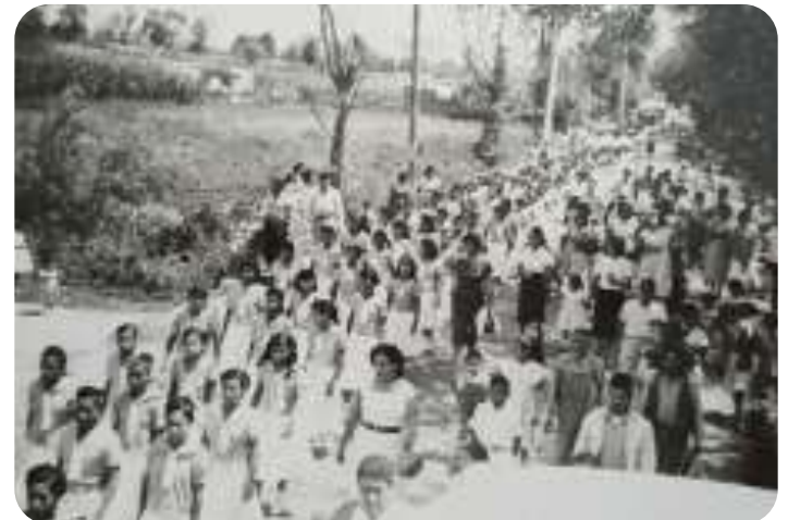
Primer desfile 1961 en Av. San Antonio donde participa la Secundaria.